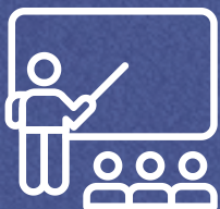
Cursos e eventos

As hospitalidades deverão atender aos seguintes requisitos: